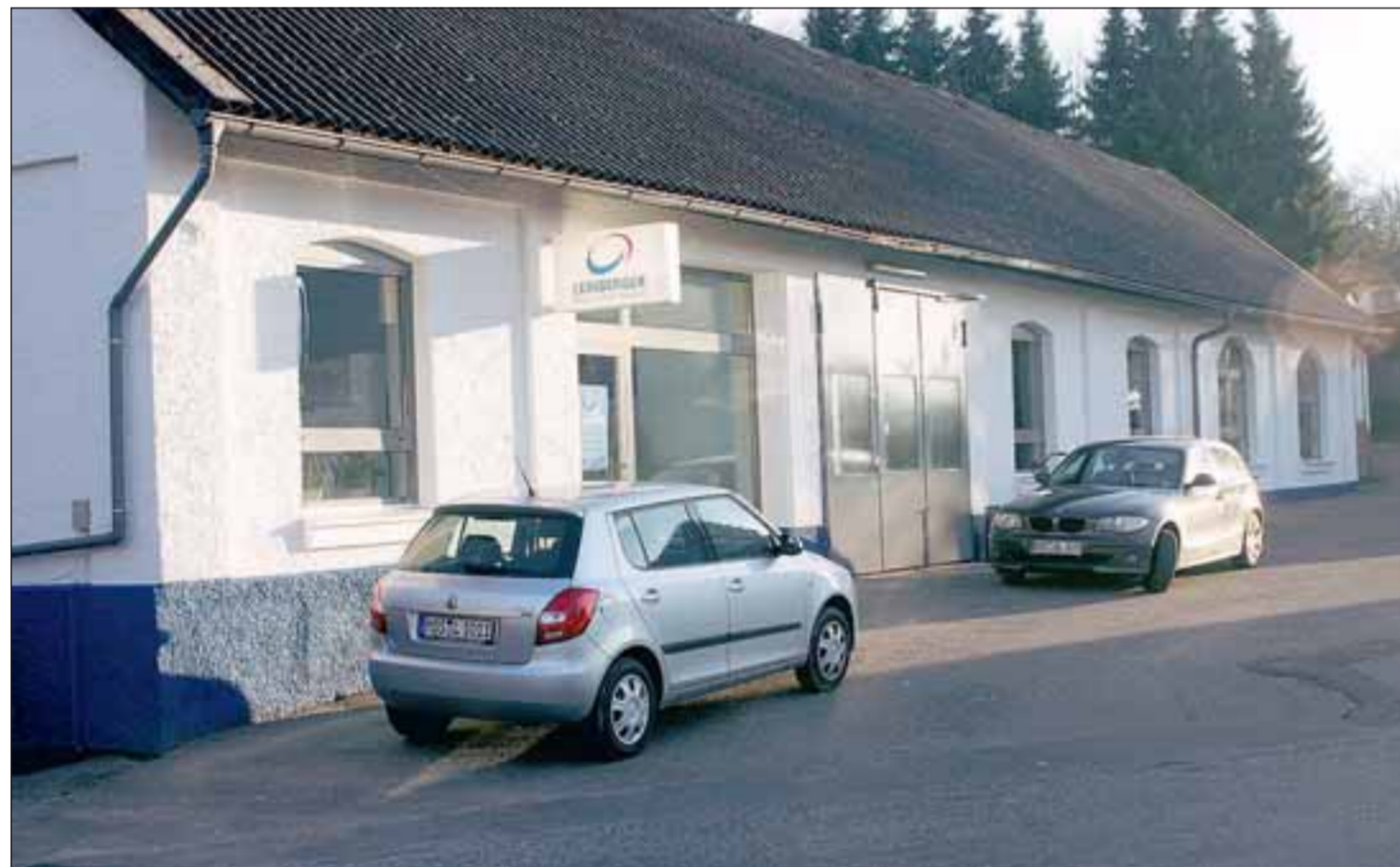
In den ehemaligen Produktionsräumen der Bäckerei Banschbach im Aglasterhausener Turnhallenweg hat die Leinberger Digital- und Printmedien GbR ihren neuen Standort gefunden.